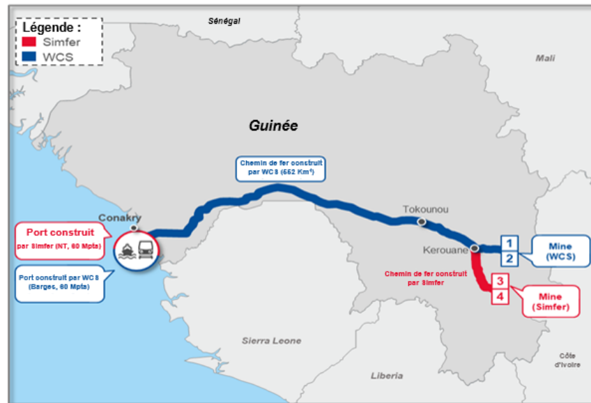
Figure 1: Carte du projet Simandou

la région à travers à l'accès aux infrastructures pour les utilisateurs tiers.